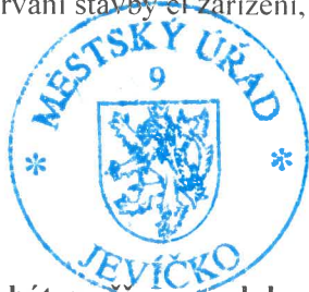
Bc. Jindřich Beneš Vedoucí odboru výstavby a ÚP Městského úřadu Jevíčko

Rozhodnutí má podle § 93 odst. 1 stavebního zákona platnost 2 roky. Podmínky rozhodnutí o umístění stavby platí po dobu trvání stavby či zařízení, nedošlo-li z povahy věci k jejich konzumaci.