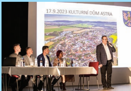
Beseda s důchodci proběhla letos v sále KD ASTRA