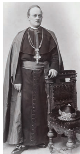
Olomoucký arcibiskup prof. ThDr. Theodor Kohn

K rezignaci byl Kohn donucen v lednu 1904, a to komisí kardinálů v Římě a novým papežem Piem X. Poté jej papež jmenoval titulárním arcibiskupem pelusijským. Zbytek života prožil ve štýrském Ehrenhausenu, kde ho až do jeho smrti navštěvovali mimo jiné i jeho příznivci i odpůrci především z Moravy, ale i z Čech, včetně básníka Josefa Svatopluka Machara, který se stal také jednou z postav v Kamenově románu Splín arcibiskupa Kohna .