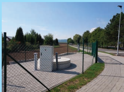
Ukončili jsme 1. etapu zainvestování průmyslové zóny