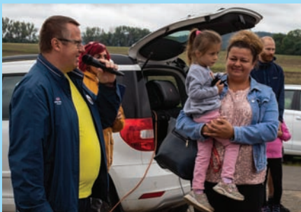
Charitativní akci Jevíčské dobrokilometry podpořila veřejnost i řada firem