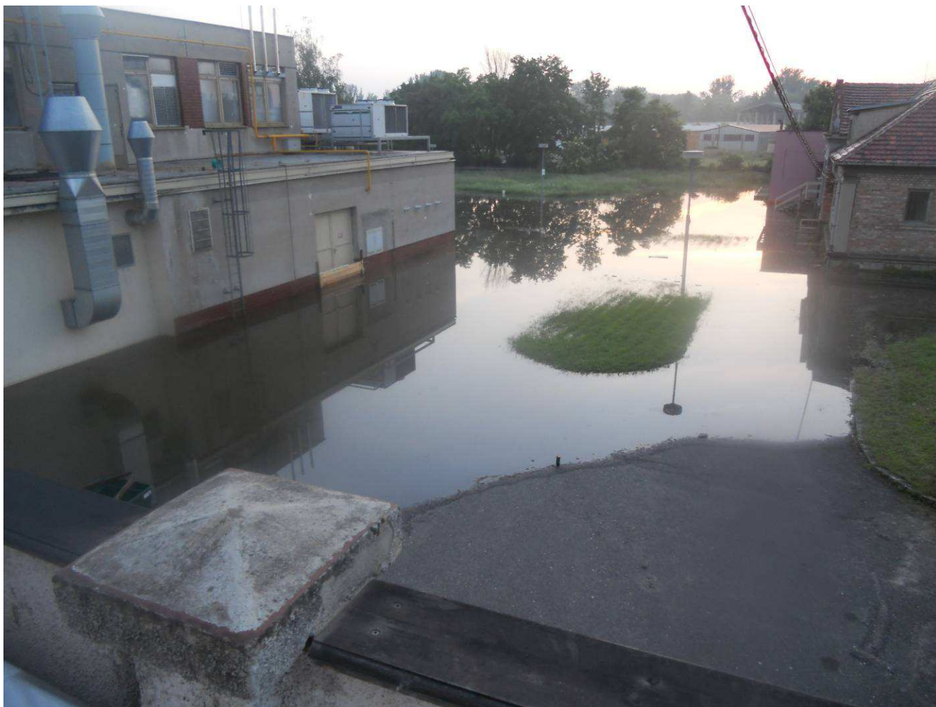
situace na místě, zaplavené prostranství firmy