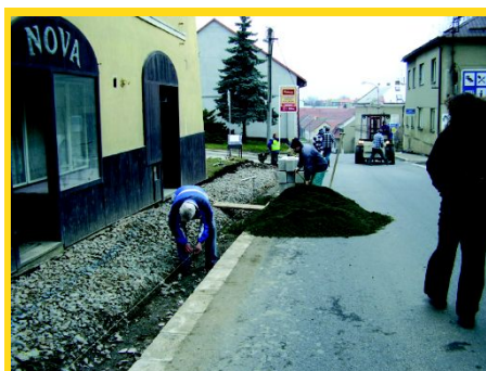
CHODNÍK TŘEBOVSKÁ UL.