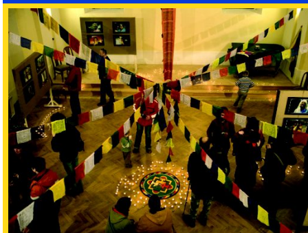
TIBETSKÉ DNY 2008