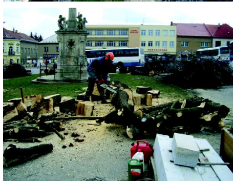
Tři lípy byly takto narušeny