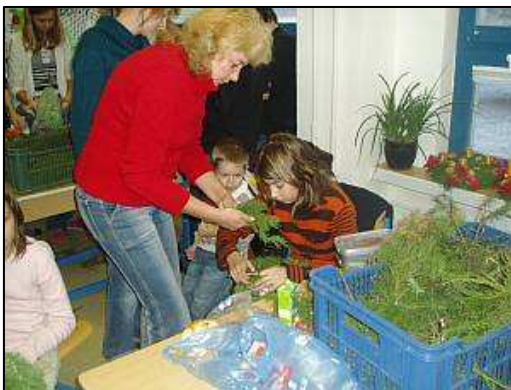
Vánoční dílna 29. 11. 2007