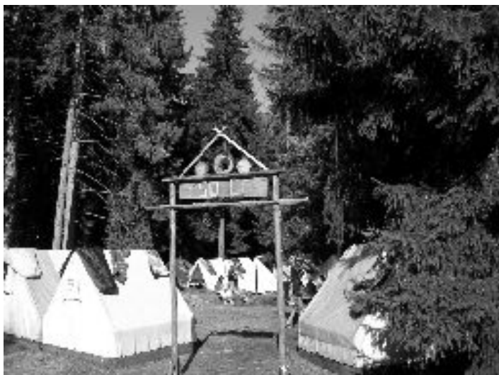
Letošní táborová brána