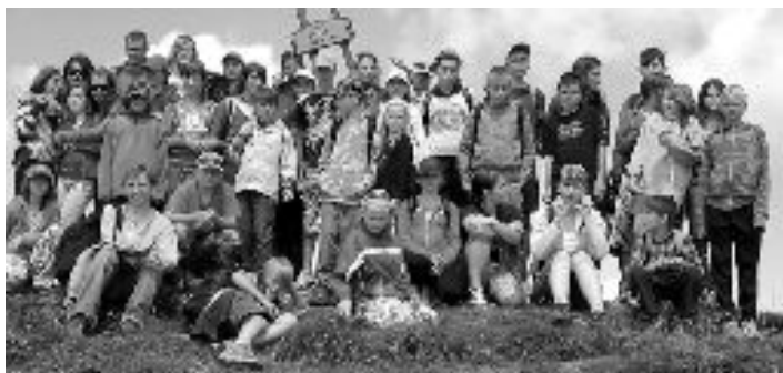
Táborníci na vrcholu Babek

červenec a tábořiště by po prvním turnusu osířelo. Objevila se myšlenka co tak uspořádat vodárenský tábor. A byla tu nová tradice. Děti zaměstnanců SeVaKu a děti zaměstnanců VHOS, a.s. Moravská Třebová začaly jezdit do Bobrovice. Trvalo to až do roku 2005. Pak děti zaměstnanců odrostly a druhý turnus skončil. Aby toho nebylo málo, oslovili nás v roce 2002 pionýři z Okříšek u Třebíče. Přišli o tábořiště a na Slovensku ještě nikdy nebyli. V Bobrovci tábořili dva roky, přestože tvrdili, že na jednom místě nikdy netábořili dvakrát.