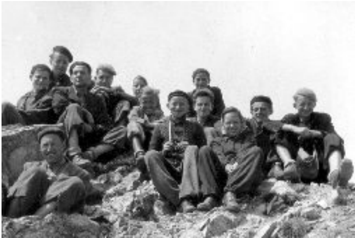
Na vrcholu tatranského Kriváně