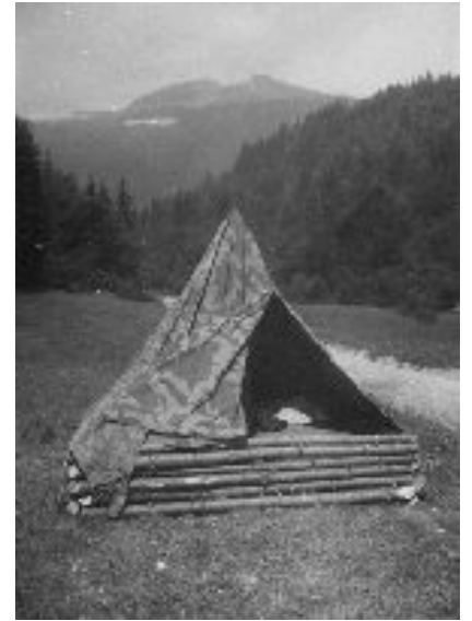
Tábor v Zázrivské dolině

Dalším takovým zlomem byl rok 1991. Byli jsme nuceni přesunout tábor na louku. Pohnulo se jakési táborové soukolí a v roce 1992 došlo k výměně vedení tábora. Základní škola přerušila kontakt a jediným organizátorem a pořadatelem se tak stal Pionýr Jevíčko. Začala nová éra v duchu hesel: Slunci, horám, mládí, vlajce. Více jsme se soustředili na obnovu táborového inventáře. Podařilo se nám postavit pět nových stanů s dřevěnou podsadou. Před rokem 1969 v táboře Mier