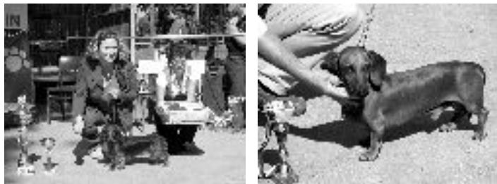
Vítězný jezevčák se svojí majitelkou

10. srpna 2008 se areál TJ SK Jevíčko stal dějištěm setkání milovníků jezevčků z celé České republiky. Proběhla tu soutěžní klubová výstava jezevčků rozmanitých plemen (viz. foto). Slunečné počasí a prostorný areál – to obojí přispělo ke spokojenosti pořadatelů i návštěvníků.