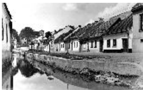
Pobled do ulice Okružní IV s nábonem pro Horní „panský“ mlýn, který patřil za první republiky k nejmodernějším na Malé Haně.