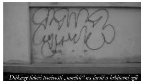
Děky lidové tvořivosti „umělců“ na farní a hřbitovní zdi