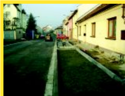
Rekonstrukce Okružní II zdárně dokončena