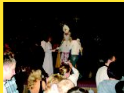
Mikulášský karneval – 7. 12. 2008